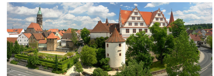
Panorama Schloss Ratibor

Der Eisenhammer im Rother Ortsteil Eckersmühlen zeigt seinen Gästen hautnah die Kunst des Hammerschmiedens. Zu sehen sind außerdem eine Auswahl der dort produzierten Werkzeuge sowie die Räumlichkeiten im Herrenhaus des damaligen Schmieds. Öffnungszeiten: März, Sa, So, Feiertag sowie April-Oktober, Mi-So, Feiertag von 13-17 Uhr, www.urlaub-roth.de