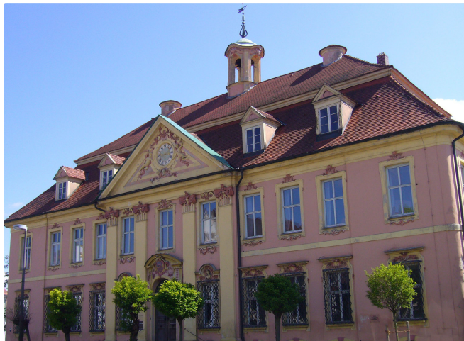
Gilardihaus (Markt Allersberg © Markt Allersberg)