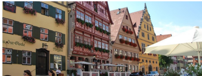
Deutsches Haus

Ausgangspunkt für unseren Rundgang ist die VGN-Haltestelle am Bahnhof. Über den Parkplatz „Schwedenwiese“, durch das Wörnitztor gelangt man über den Altrathausplatz - auf dem sich das Haus der Geschichte mit der Tourist-Information befindet - zum Münster St. Georg und dem Weinmarkt mit der Schranne, dem Deutschen Haus (Renaissancefassade) und dem Gustav-Adolf-Haus. In der Segringer Straße, gegenüber dem Gustav-Adolf-Haus, liegt der Eingang zum Hezelhof, dem malerischen Innenhof eines Patrizierhauses aus dem 16. Jahrhundert.