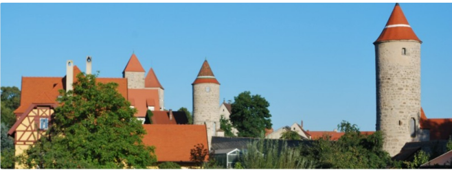
Stadtmauer mit Türmen