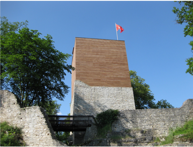
Treuchtlingen Burgruine ObereVeste (05.11.2015, Informationszentrum Treuchtlingen)