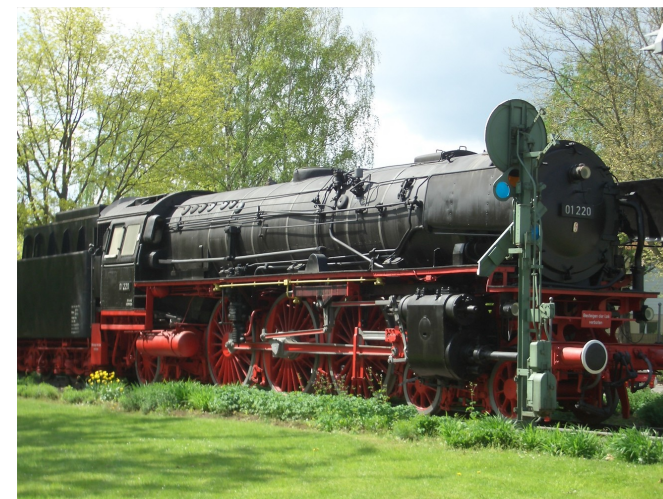
Treuchtlingen Denkmalslok (05.11.2015, Informationszentrum Treuchtlingen)