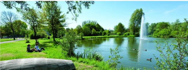
Treuchtlingen Kurpark See (05.11.2015, Informationszentrum Treuchtlingen)