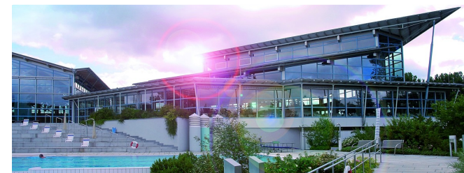
Treuchtlingen Altmühltherme Aussenansicht (05.11.2015, Altmühltherme Treuchtlingen)

1757 ließ der „Wilde Markgraf“ Carl Wilhelm Friedrich anstelle einer Marienkapelle die evangelisch-lutherische Pfarrkirche im „Markgrafenstil“ erbauen.