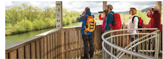
Aussichtsturm in der Mainaue (06.02.2018, Haßberge Tourismus im Naturpark Haßberge)

Weitere Informationen zu dem Life-Projekt finden Sie unter www.mainaue.de