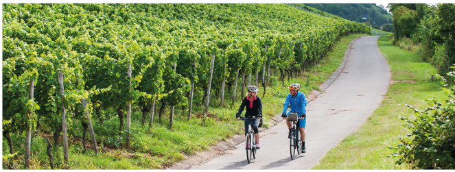
Abt Degen Weintal (06.02.2018, Haßberge Tourismus im Naturpark Haßberge)