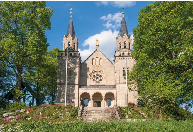
Zeiler Käppele (06.02.2018, Haßberge Tourismus im Naturpark Haßberge)