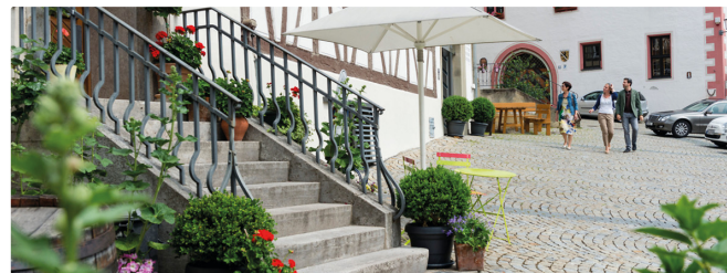
Marktplatz "Gute Stube" (06.02.2018, Haßberge Tourismus im Naturpark Haßberge)

Einer der schönsten fränkischen Kleinstadmarktplätze. Geprägt durch das spätgotische Rathaus mit der Jahreszahl 1540 und einem Unterbau aus dem 14. Jh. (an der Ecke Pranger und Bamberger Elle). Dem Rathaus gegenüber steht das ehemalige Rosenbergische Zehnthaus, das dem Barockbaumeister Johann Jacob Michael Küchel zugeschrieben wird. Daneben steht das katholische Pfarrhaus im klassizistischen Stil.