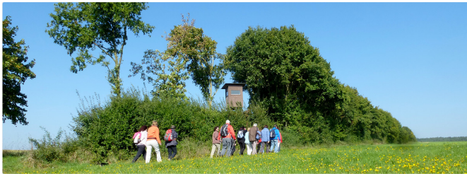
Wiesenweg nach Gutenstetten (28.09.2013,)

Noch vor dem Ortsende-Schild heißt es rechts ab (7,5-t-Schild), die örtliche Markierung G2 immer noch zusätzlich als deutlicher Anhaltspunkt. Hinter einer großen Scheune eröffnen sich erste Ausblicke: zurück über Diespeck bis nach Neustadt an der Aisch, vor uns der „Aaaschgrund“, wie er im Volksmund genannt wird. Im anschließenden Rechtsbogen (Jägerstand) verlassen wir den geschotterten Weg nach links und wandern an einer lang gezogenen Baumreihe, dazwischen ein Rastplatz, den Wiesenweg hoch bis zu einem asphaltierten Sträßchen, dort dann rechts kurz abwärts.