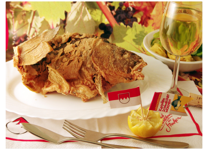
Gebackener Karpfen