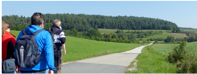
Hinunter ins Engelsbachtal (28.09.2013,)

und hinaus auf die Felder. Rund 300 m müssen auf der Straße in Kauf genommen werden, bevor wir diese gegenüber einem kleinen Weiher nach rechts verlassen können (7,5-t-Schild).