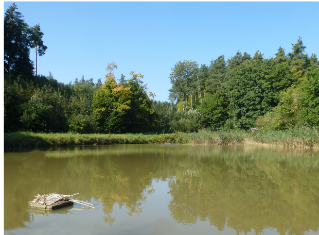
Im Karpfenland

Fernab von jeglichen bekannten Wanderwegen des Aischgrundes führt uns diese Wanderung über sanfte Hügel, durch einsame Wälder und Täler entlang mancher Weiher im südlichen Steigerwald. Zur Karpfenzeit wird der Aischgründer Karpfen in den am Wegesrand liegenden Gasthöfen von den Wirten traditionell blau oder gebacken angeboten.