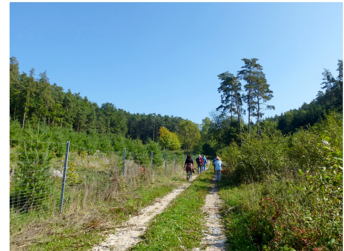
Auf dem Weg nach Rauschenberg (28.09.2013,)

Um die folgende Kuppe haben Waldarbeiten deutlich ihre Spuren hinterlassen, es ist stellenweise etwas unebener und verwilderter. Bald wird es wieder grasiger – und es ist angenehm und schön zu laufen. In der Abwärtspassage gabelt sich der immer noch nicht ausgeschilderte Weg, links ist hier unser Abzweig. Der an manchen Stellen mit Bauschutt durchsetzte Waldweg verzweigt sich an einer kleinen freien Fläche erneut – geradeaus bleibt die Laufrichtung.