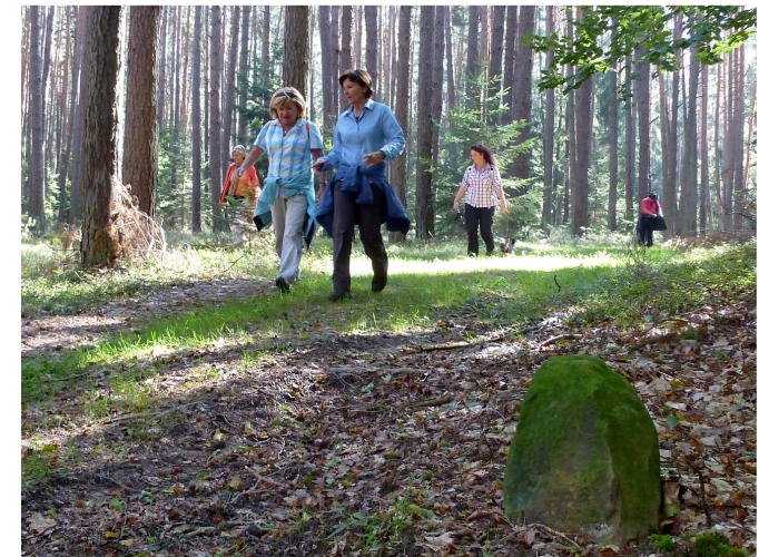
Wegbegleiter: Alte Grenzsteine (28.09.2013,)

Die eingezäunten Schonungen flankieren uns bald beidseits, danach taucht der kurzfristig wieder mit Gras überzogene Weg in den dunkler werdenden Wald ein. Moderat geht es aufwärts, bis wir in einem Querweg nach links einfädeln, der sich nach ca. 10 m gabelt. Hier nicht den Moos überzogenen Pfad, sondern stets auf dem Hauptweg bleibend nach oben. Nach einigen Metern vereinigt sich der Waldweg mit einem von rechts kommenden Zuweg und steigt weiter, begleitet von bemoosten Grenzsteinen , leicht an.